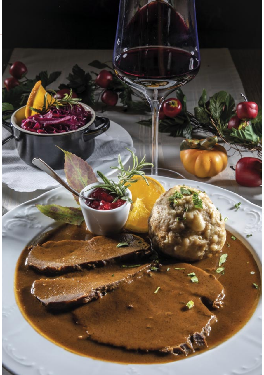
Hirschbraten im Gasthof Thomahan. Hirschbild bzw. -zeichnung: Fladenhofer, Mangold

Wenn das Super-Bio-Produkt Wildbret kulinarisch veredelt wird, juchzt das Herz eines jeden Gourmets. Jetzt ist Hochsaison.