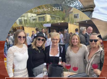
Übelbacher Steirerfest 26. Oktober