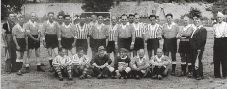
1953: Eine „Gemeinderats-Auswahl“ als allererstes Peggau-Team