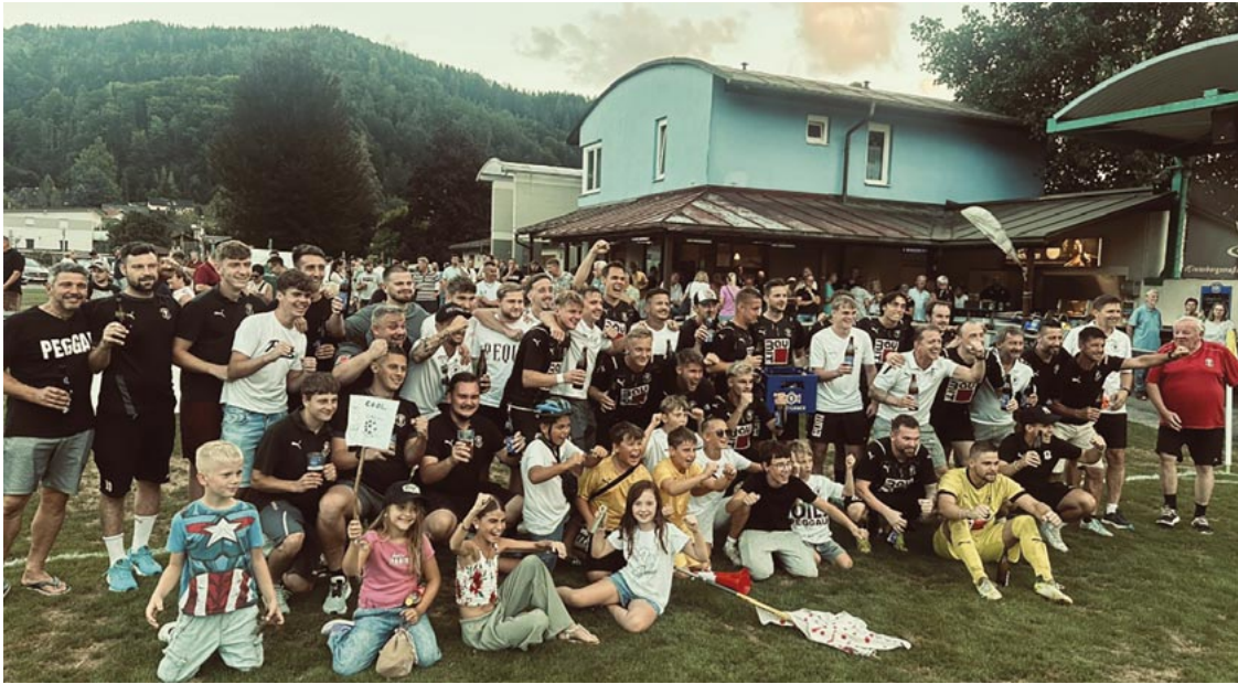
So sehen Sieger aus: Die Mannschaft des SV Peggau mit Funktionären und Fans nach dem 2:0 -Derbysieg gegen Übelbach