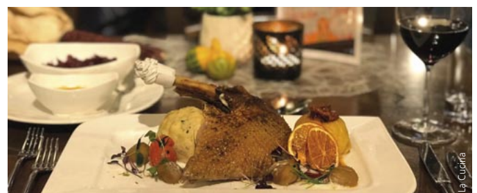
Der November-Klassiker Martini-Gansl