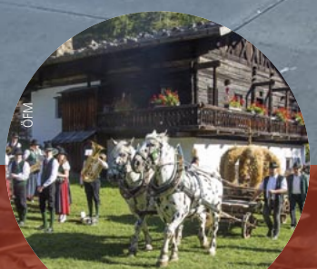
Erlebnistag im Freilichtmuseum Stübing, 29. September

Und tolle Herbstfeste gibt's auch. Alle Termine auf S. 28/29