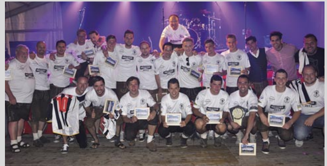
Das Unterliga-Meisterteam von 2013

Begonnen hat alles auf der damaligen Ertl-Wiese. Auf Initiative des damaligen Bürgermeisters Johann Glauninger wurde 1954 der Peggauer Fußballverein gegründet. 1971 wurde die neue Sportanlage in Hinterberg eröffnet. Auch die sportlichen Erfolge mit mehreren Meistertiteln in den jeweiligen Ligen ließen nicht lange auf sich warten. Seit 1994 heißt der Verein aufgrund seines Sponsors SV Baunit Peggau.