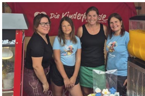
Die Vereine sorgten für tolle Spiele und attraktive Standl.